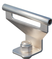
SI pass Seilzwischenhalter überfahrbar Art. 03IND105