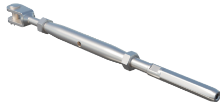
Tighter Spannvorrichtung Art. 03IND102