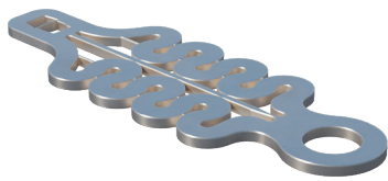
Damper Falldämpfer Art. 03IND101