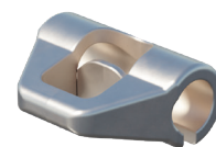
Indy Line Slider Seilgleiter für überfahrbares System Art. 03IND110