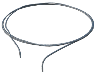
Rope Rostfreies Stahlseil 7x19 Drähte - ø 8 mm Art. 03IND100