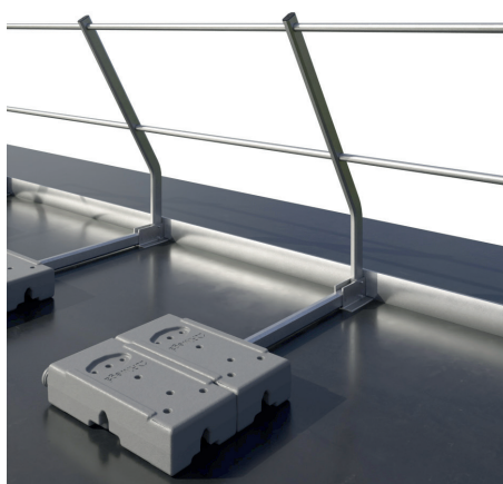
Con veletta \leq 5 cm - Rientranza min. 1 m dal bordo