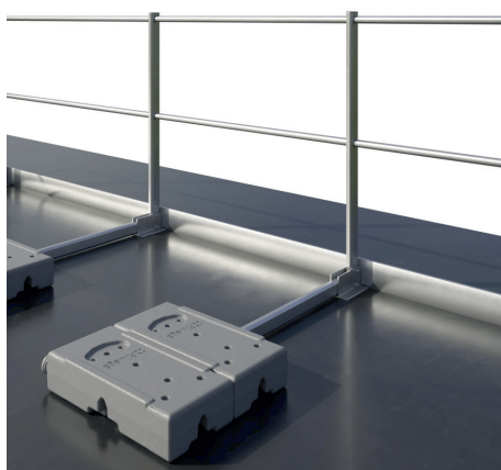
Con veletta \leq 5 cm - Rientranza min. 1 m dal bordo