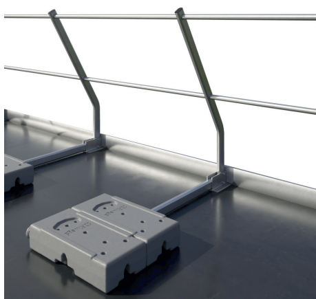
Versione 1 - con veletta da 5 cm a 10 cm