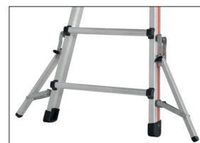
Zubehör EN 131