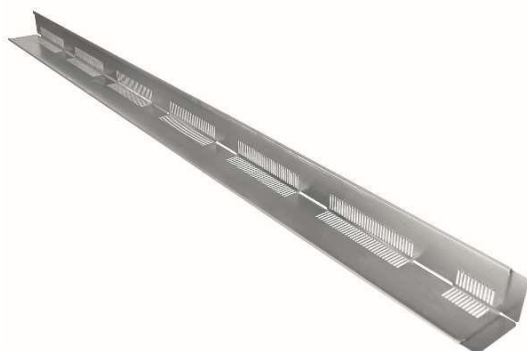
Profilo paraghiaia in alluminio da 1.5 mm forato